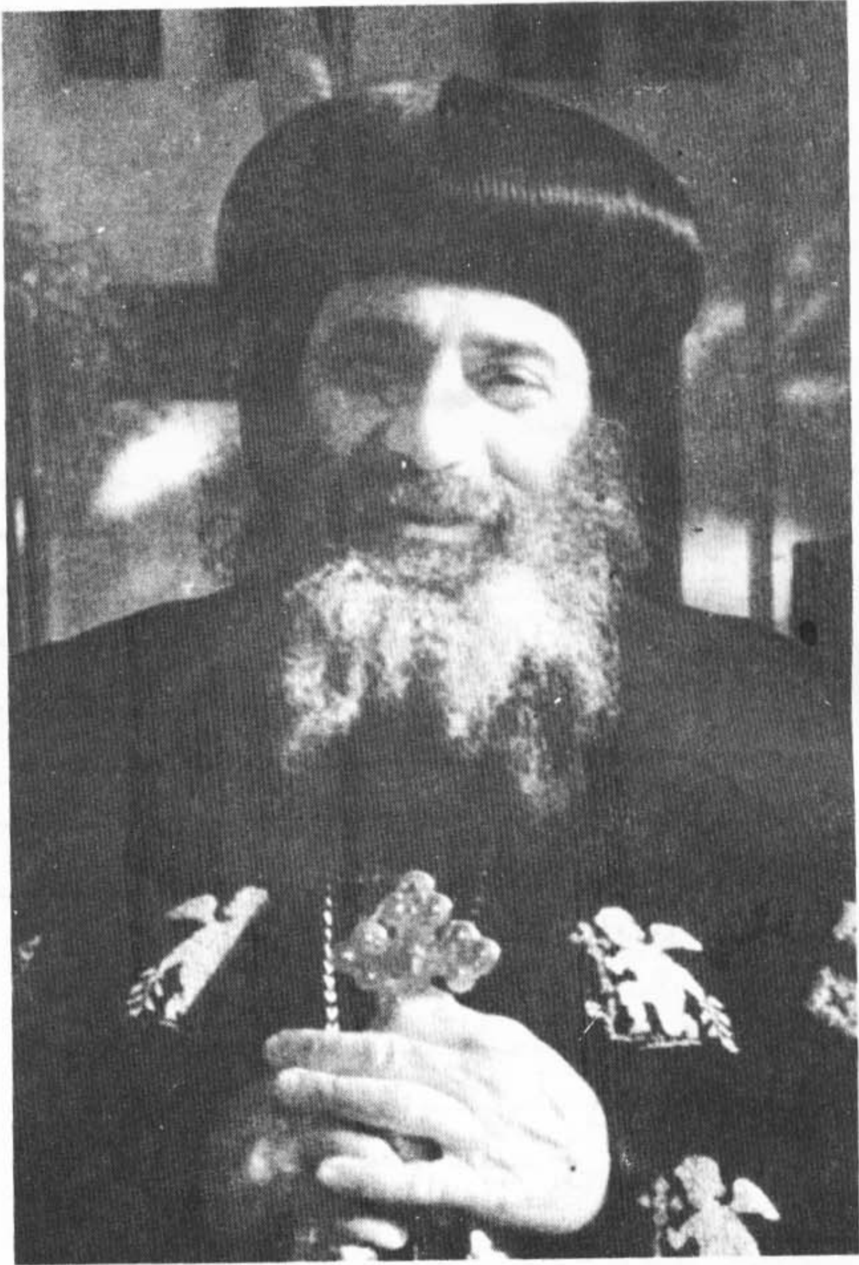
حضرة صاحب القداسة البابا المعظم الأبنا شنودة الثالث بابا الاسكندرية وبطريك الكرازة المرقسية