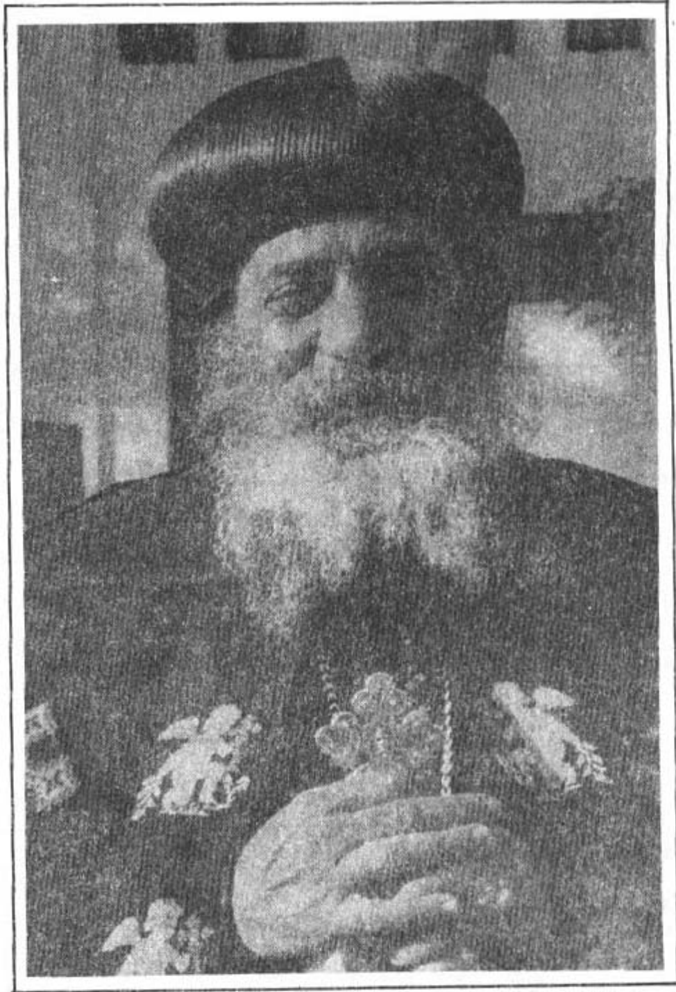
قداسة البابا شنودة الثالث بابا الإسكندرية وبطريك الكرازة المرقسية