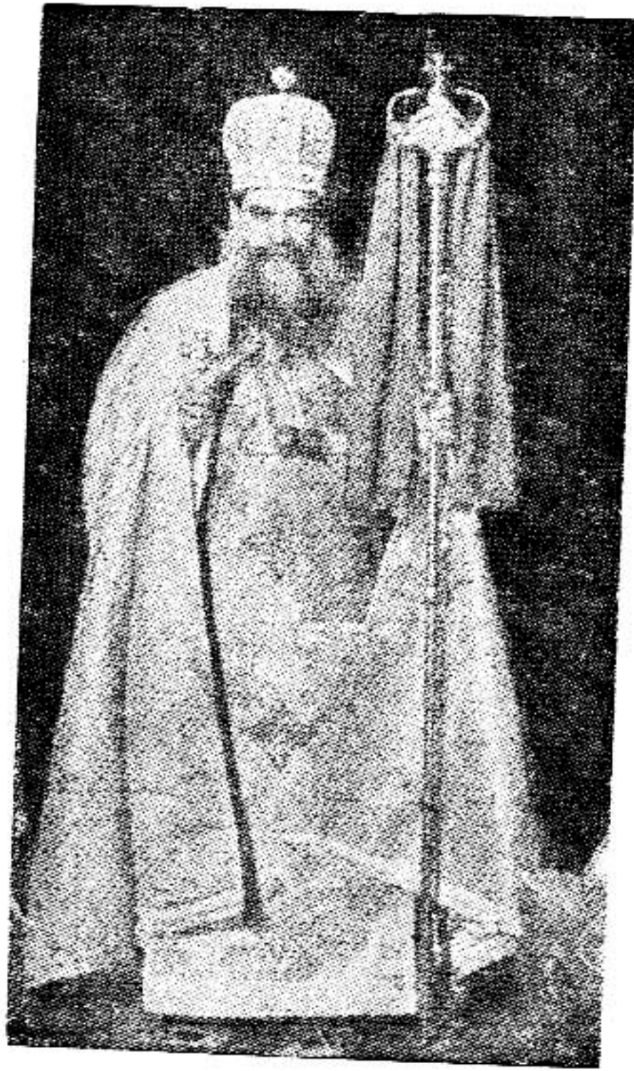
صاحب القداسة والغبطة البابا كيرلس السادس بابا الاسكندرية وبطريك الكرازة المرقسية