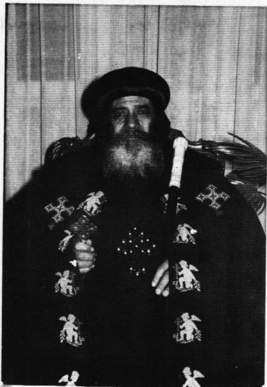
قداسة البابا المعظم الانبا شنودة الثالث بابا الإسكندرية وسائر اقاليم الصحراوية المرقسية ( ١١٧ ج )