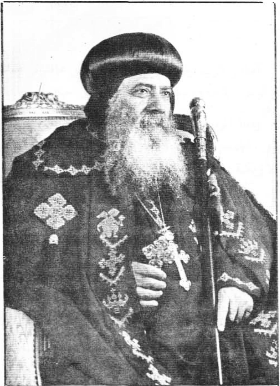
قُدَامَةُ الْبَابَا شَنُودَه الثَّالِث