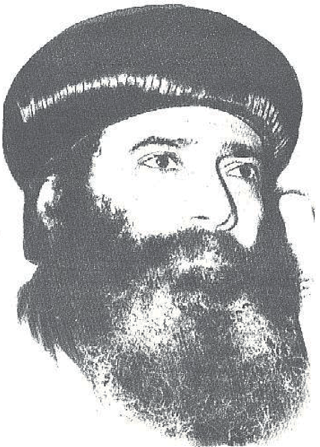
عمارة عماد الدين القائل والغير الابا شتودة الثالث بابا الإسكندرية ويطن يروى انكازة الرئيس