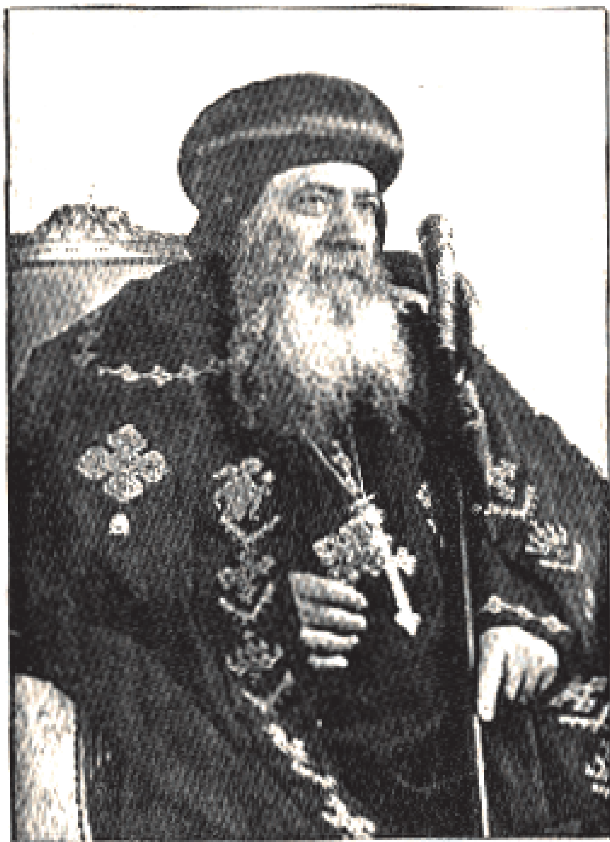
قدامة البابا شنودة الثالث