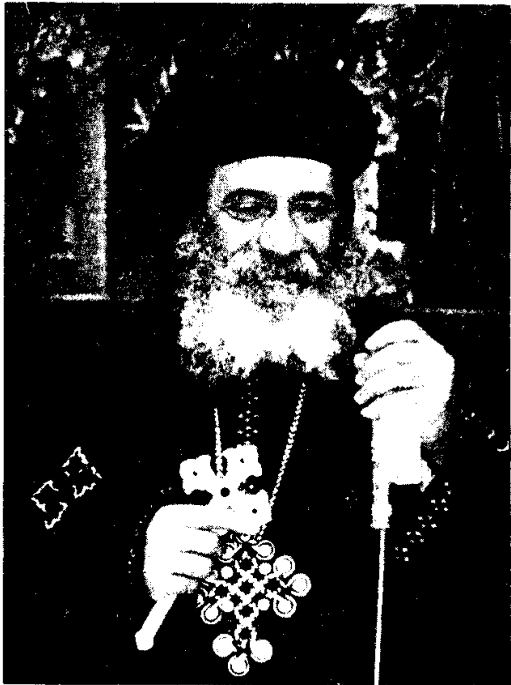
قداسة البابا شنودة الثالث بابا الإسكندرية وبطريك الكرازة المرقسية