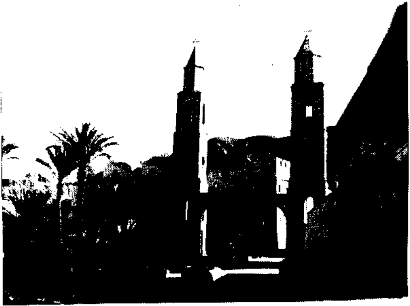
دير القديس العظيم الأنبا أنطونيوس

مبارك هو اليوم ، الذي قبل فيه الأنبا أنطونيوس ، أن يرشد آخرين ، ويعلمهم هذا الطريق الملائكى الذى اختبره •