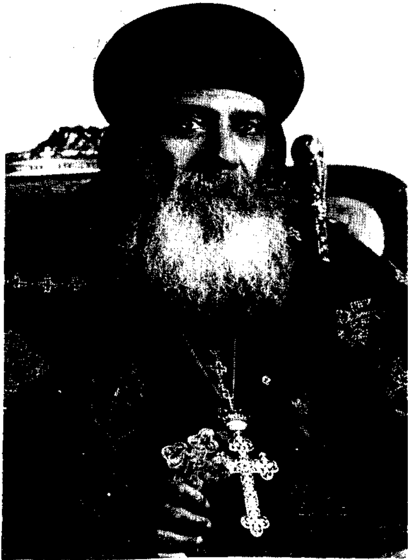
عمارة عالمين القديسة والغبارة الابا شنودة الثالث بابا الإسكندرية وبطريك الكنيزة المروية