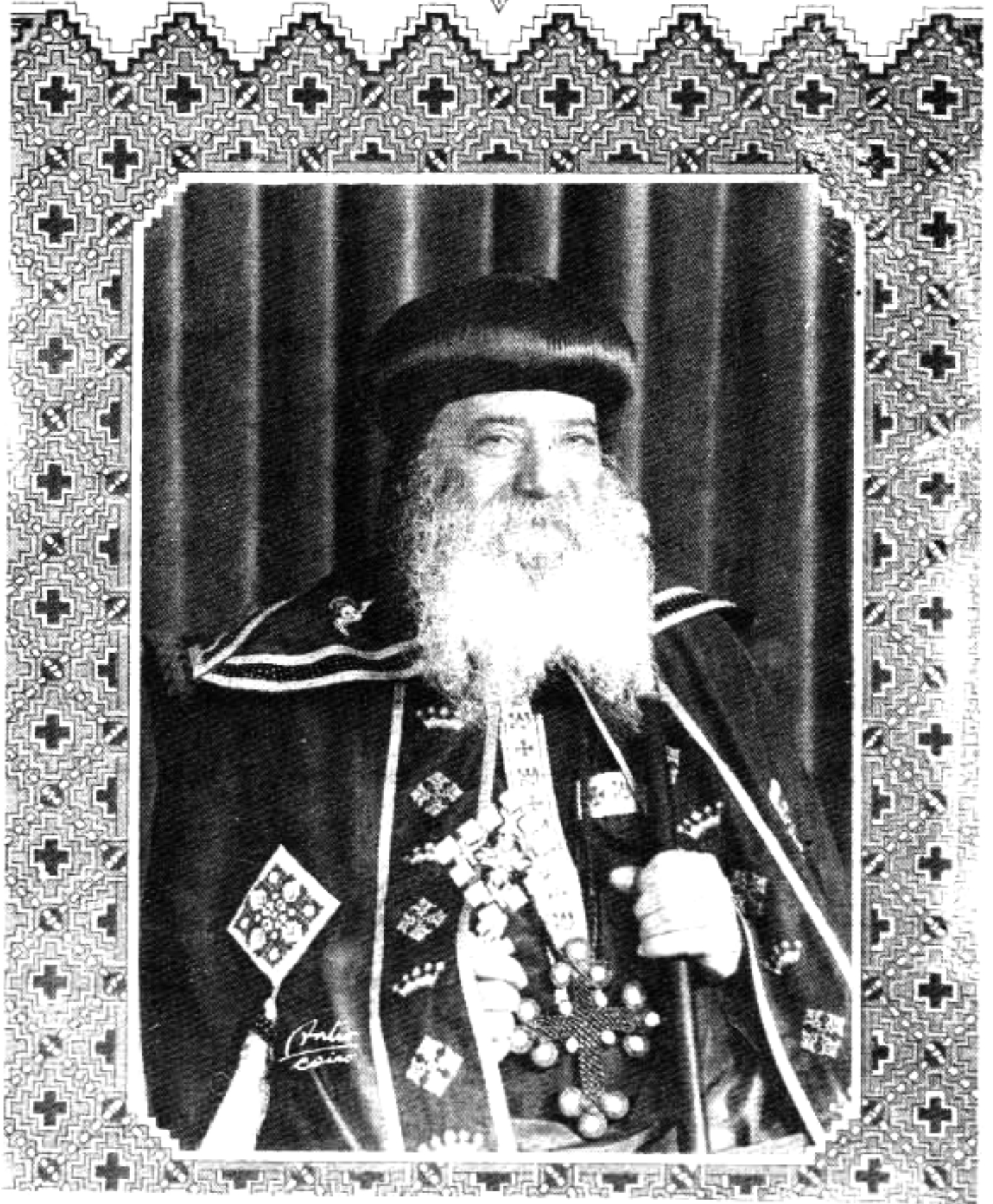
قداسة البابا شنودة الثالث بابا الإسكندرية وبطريك الكرازة المرقسية