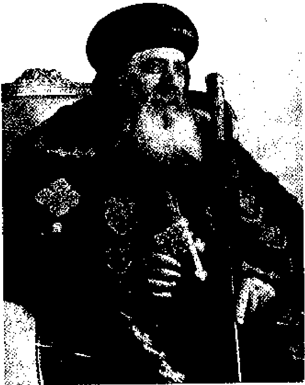
قداسة البابا شنودة الثالث