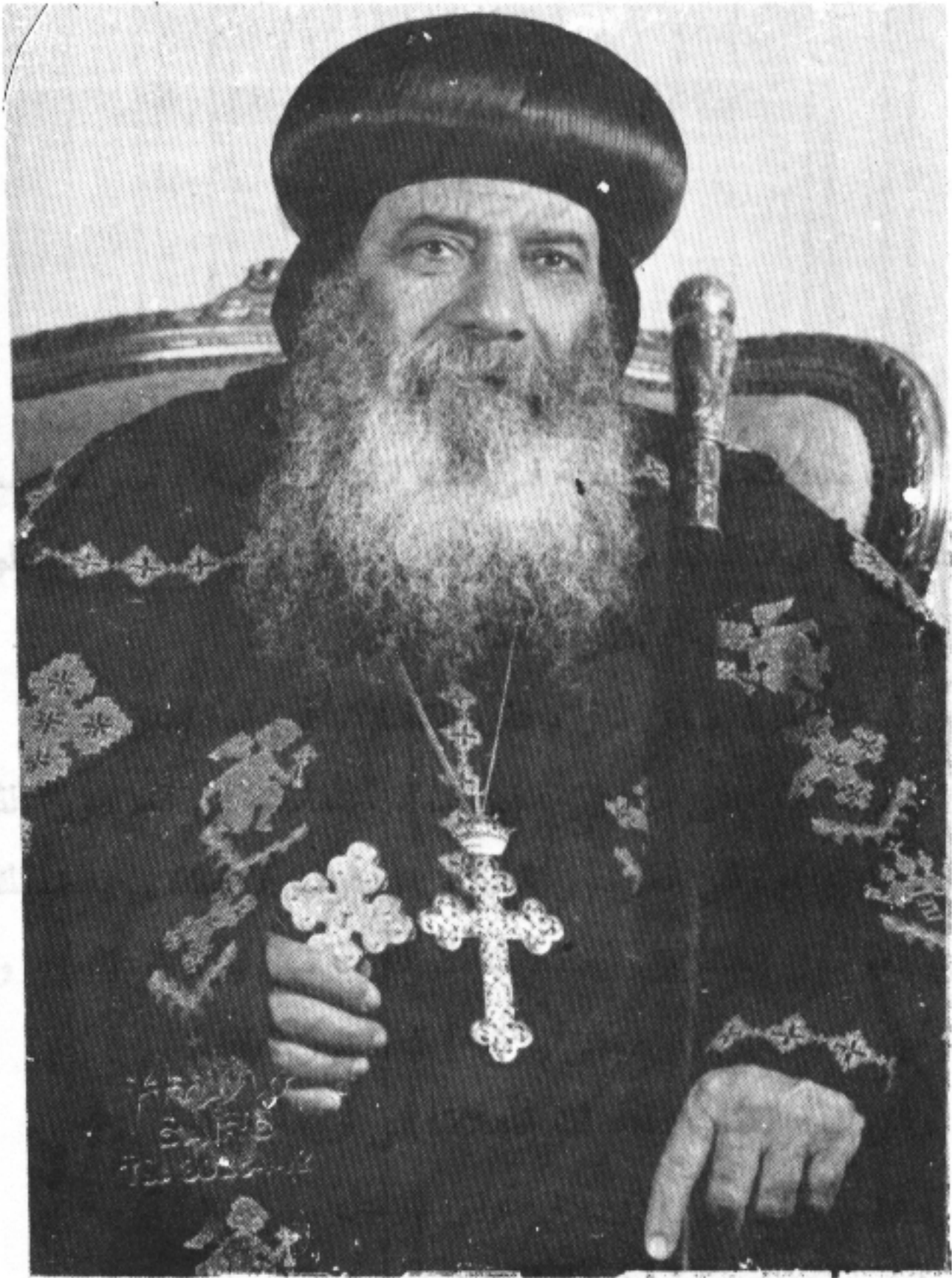
قداسة البابا العظيم للأنبا سنبوثة الثالث