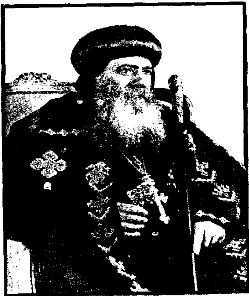
صاحب القبة البايا العظيم الأنبا شنودة الثالث